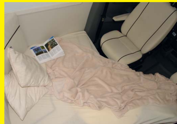
Optional entsteht aus der Sitzgruppe ein dritter Schlafplatz