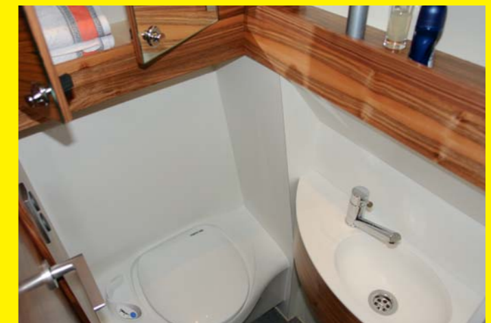
Sanitärbereich mit Kassettentoilette, Mineralwerkstoffwaschtisch