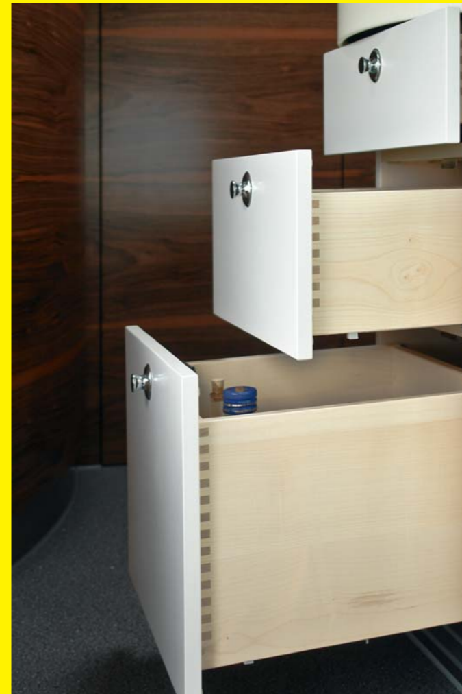
Gezinkte Schubkästen mit Softteinzug, belastbar mit 30 kg

Die Fotos zeigen die Sonderausstattung »Möbeldekor exclusiv« in franz. Nussbaum.